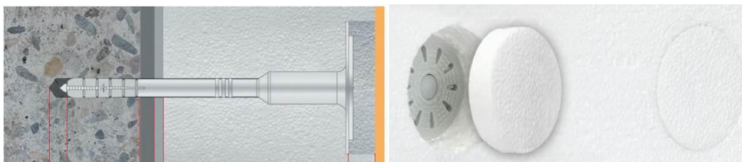
Rys. 2. Wymagany montaż styropianu – montaż zagłębiony ukryty z zastosowaniem krążka styropianowego.